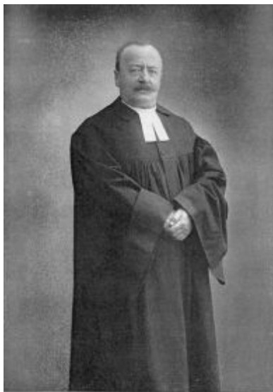
Székely István, költő, püspök.

1907-ben Gödön nyaralót vásároltak. Az ott szerveződő gyülekezet első istentiszteleteit az ő "nyári hajlékában" tartották